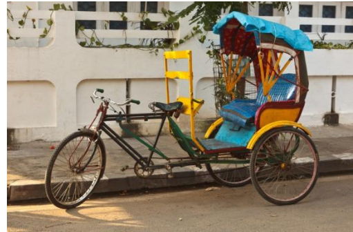
Riksja of jinriksha

De tuk-tuk is een rechtstreekse 'afstammeling' van de vroegere vorm van transport op wielen namelijk de door menskracht aangedreven jinriksha of riksja. Tuk-tuk is een klanknabootsing, die het geluid van de vaak pruttelende tweetakmotoren nabootst. De Thaise naam sam lor betekent letterlijk sam = drie en lor = wiel, dus een driewieler. Beide namen worden in Thailand door elkaar gebruikt.